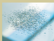
S5 / P6