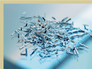
S3 / P4