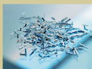
S3 / P4