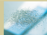
S6 / P7