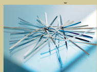
S2 / P3