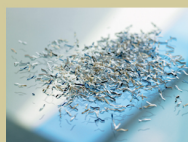
S4 / P5