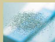
S6 / P7