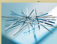
S2 / P3