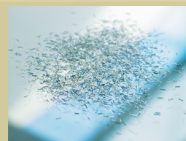
S5 / P6