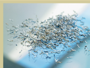
S4 / P5